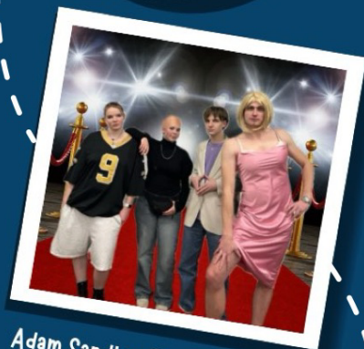
Adam Sandler, The Rock, Angela Merkel, und Margot Robbie.

Unter dem Kommando der Lüdinghausener Messdiener stechen wir am 28.03.2026 in See und starten eine Kreuzfahrt, wie sie die Welt noch nicht erlebt hat.